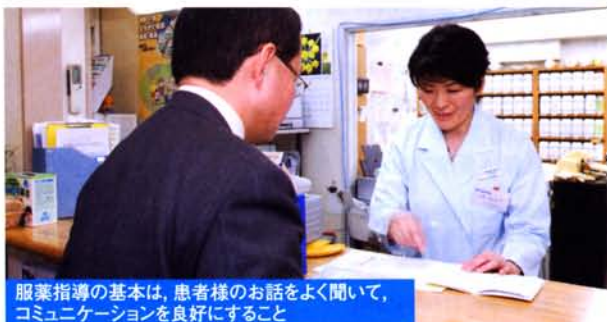
服薬指導の基本は、患者様のお話をよく聞いて、コミュニケーションを良好にすること