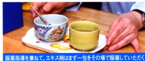
服薬指導を兼ねて、エキス剤はまず一包をその場で服薬していたく