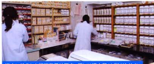
漢方に特化した朝陽薬局神戸店。棚には漢方薬がずらりと並ぶ。