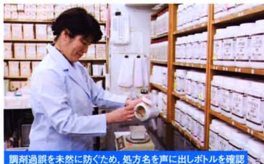
調剤過誤を未然に防ぐため、処方名を声に出しボトルを確認